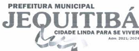
Luiz Carlos Pinheiro Prefeito Municipal de Jequitibá