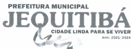
Luiz Carlos Pinheiro Prefeito Municipal